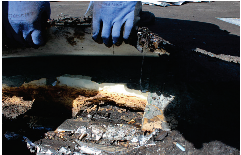
Figur 8: Der hvor brannen var under taket, ble isolasjonen i bunnen skadet.