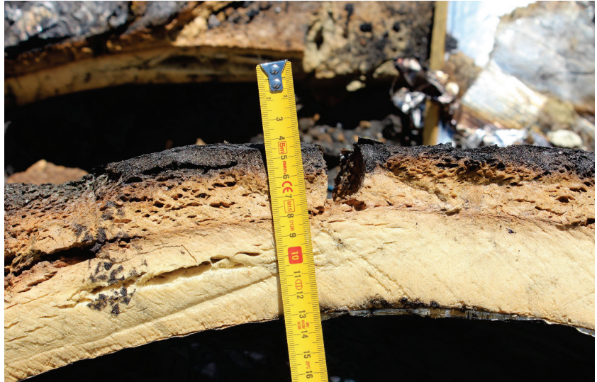
Figur 7: Der brannen spredte seg over taket, ble isolasjonen varmet opp ovenfra og begynte å utvide seg.

Der isolasjonen var igjen, var den synlig skadet opp til 30 mm dypt fra toppen (figur 7) eller fra bunnen (figur 8), avhengig av hvor brannen hadde oppstått (først en innvendig brann, deretter en utvendig brann).