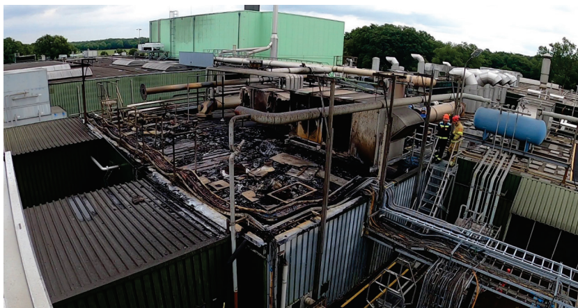
Figur 6: Oversikt over det skadede taket. Bak ventilasjonsaggregatet er også en del av taket brent.

Efectis gjennomførte en undersøkelse av taket på den 13. juli 2020. På undersøkelsestidspunktet var taket i ferd med å bli rengjort for reparasjon, og deler av isolasjonen og vanntetningsmembranen hadde blitt fjernet.