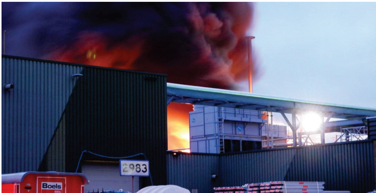
Figur 3: Brann på taket av Aviko-bygningen (kilde: Ilimburg.nl).

Klokken 05.16 ble det rapportert at hoveddelen av brannen var slukket, og klokken 05.36 var brannen offisielt under kontroll. Brannen var begrenset til ovnen, skorsteinen og taket, inkludert installasjonene på taket. Den opprinnelige brannen startet under taket, spredte seg til taket og deretter sideveis over takflaten.