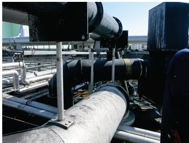
Figur 2: Inntrykk av installasjonene på taket før brannen.

I tillegg var det stålkonstruksjoner for å støtte rør og ventilatorer (figur 2). Rørene var laget av metall og polypropylen (PP). Noen av rørene var isolert med mineralfiberisolasjon. Deler av taket var dekket med betongfliser for å støtte installasjonene, og gangstiene var laget av gummifliser.