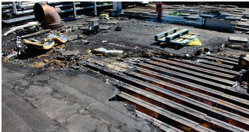
Figur 5: Deler av det brente taket.