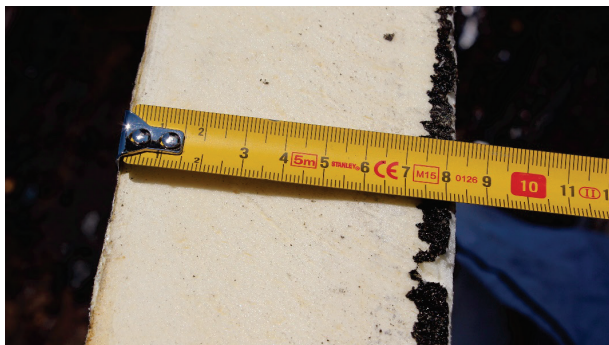
Figur 1: 80 mm Kingspan Therma™ TR26-isolasjon.

Bygningen ble konstruert med en stålramme, og selve taket består av stålbjelker, stålplater, en bituminøs dampsperre, 80 mm Therma™ TR26-isolasjon** (figur 1) og en bituminøs vanntetningsmembran. Therma™ TR26 har en brannklassifisering E for produktet og B-s2, d0 i sluttbrukssituasjonen i henhold til EN 13501-1.